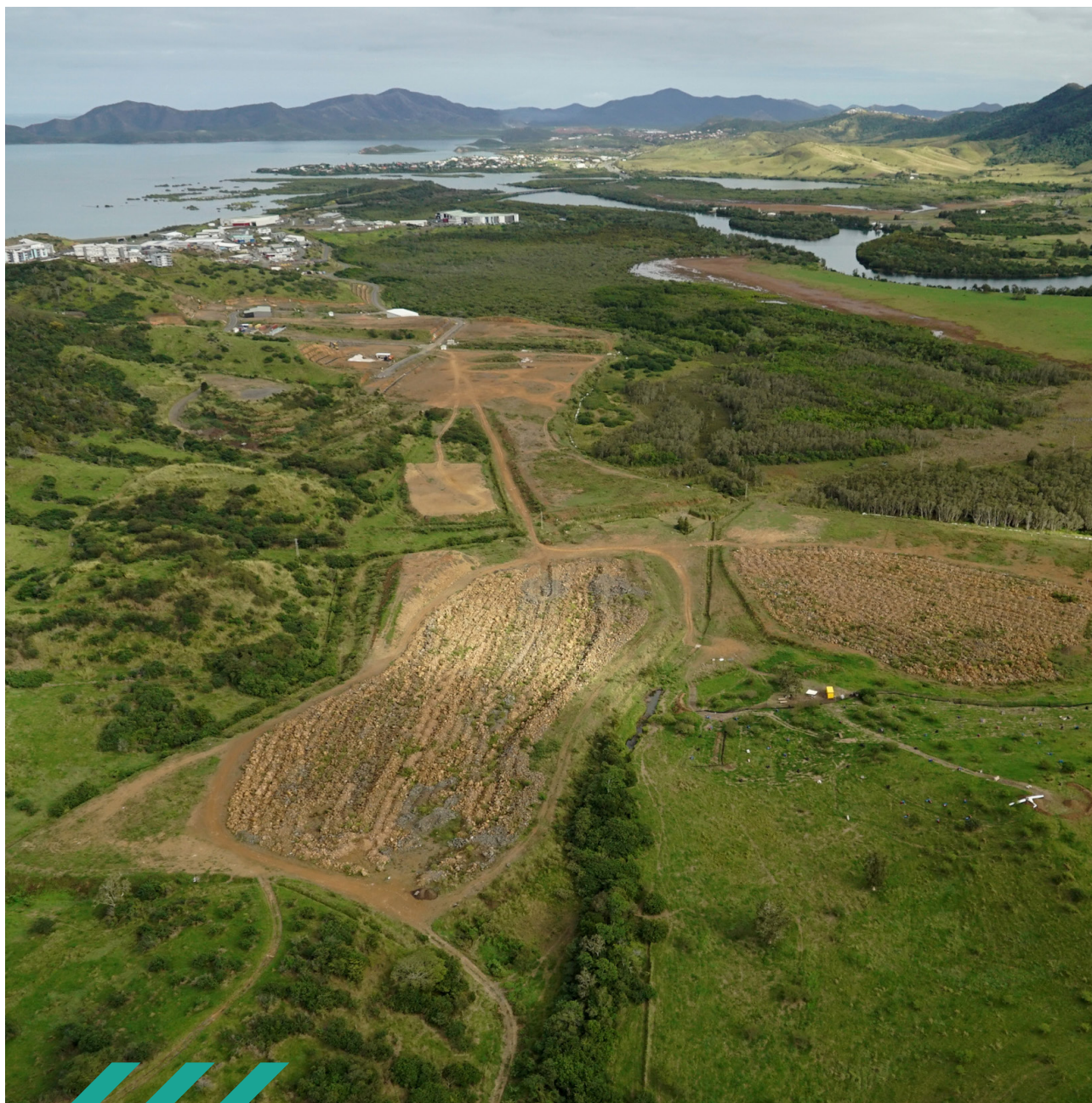
Tranche 3, 4 et 5 de la ZAC PANDA

Approuvé par délibération n°2-2023/APS en date du 16.02.23